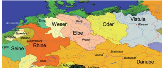
Große Flussgebietseinheiten in Mitteleuropa Karte: Stephan Gunkel/ERN

Die WRRL führt die integrierte Bewirtschaftung innerhalb von Flussgebietseinheiten , d. h. den Einzugsgebieten großer (z. B. Rhein, Elbe, Donau) bzw. benachbarter kleinerer Flüsse (z. B. Warnow/Peene) ein, mit der Verpflichtung zur grenzüberschreitenden Kooperation.