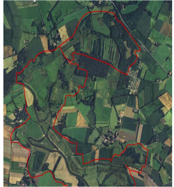
(4) E+E Vorhaben „Hasetal“ Kerngebiet zwischen den Ortschaften Haselünne-Lahre und Lehrte

Der Ankauf der ca. 450 ha Landwirtschaftsfläche und deren anschließende Umwandlung in Extensivgrünland (und teilweiser Wiedervernässung), der Ausbau von Sielbauwerken, der Abtrag der Sommerdeiche und der Wiederanschluss der Altarme und Seitengewässer führten dazu, dass die natürliche Flussdynamik der Hase weitgehend wiederhergestellt werden konnte. Mit den Maßnahmen wurde sowohl die Gewässerstruktur und -qualität der Hase, als auch die Auenanbindung deutlich verbessert. Diese Ergebnisse können somit als Umsetzung der Forderung der WRRL zum Schutz bzw. zur (Wieder-) Herstellung des „guten ökologischen Zustandes“ der Gewässer angesehen werden. Durch die Rückverlegung der Deiche entstanden zudem Retentionsräume, in denen sich die jährlichen saisonalen Hochwasser der Hase ausbreiten können. Dadurch bleiben die weiter abwärts gelegenen Gebiete der Flussniederung von Überschwemmungen verschont. Diese flussnahen Überflutungsflächen wurden zum großen Teil der freien Sukzession überlassen und bieten heute wieder Lebensraum für die landschafts- und auentypische Flora und Fauna. Die Universität Osnabrück bescheinigt dem Landkreis einen zahlenmäßigen Anstieg der Arten und Individuen im Tier- und Pflanzenreich. Da bei der Umsetzung der Maßnahmen besonderer Wert auf die Einbindung der Anlieger gelegt wurde, hat das Vorhaben zu großer Akzeptanz in der Bevölkerung und gleichzeitig zu einer Entflechtung der potentiellen Konfliktbereiche Naturschutz, Land- und Wasserwirtschaft geführt.