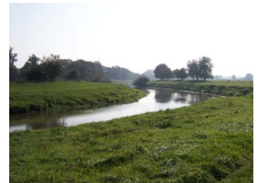
(2) stark ausgebaut Hase in Eltern

Die Hase und ihre Aue unterlagen in den vergangenen Jahrzehnten starken anthropogenen Veränderungen. In den 1970er Jahren wurde der Fluss vor allem am Ober- und Mittellauf kanalisiert und begradigt. In den 1980er Jahren endeten die meisten der Ausbaumaßnahmen, doch bis dahin waren viele Gewässerabschnitte der Hase bereits nachhaltig verändert. Folge dieser wasserbaulichen Eingriffe war eine naturferne Gewässerstruktur, die zu einer Laufverkürzung führte. Gewässerausbau und Eindeichung zogen zudem eine hydrodynamische Entkoppelung von Fluss und Aue nach sich. Parallel weitete sich die landwirtschaftliche Nutzung bis in Ufernähe aus, was einen quanti- und qualitativen Rückgang von Auenstrukturen und verstärkte Nährstoffeinträge zur Folge hatte.