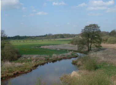
(1) reaktivierter Altlauf: Der Bleichenholter Graben

Das 1995 gestartete Projekt zur Renaturierung der Hase sah vor, eine beispielgebende Vorgehensweise für die Redynamisierung der Aue eines Flachlandflusses zu entwickeln. Schwerpunkte dieses Erprobungs- und Entwicklungsvorhabens waren die Wiederherstellung der natürlichen Flusssdynamik sowie des „guten ökologischen Zustandes“ der Hase und der von ihr abhängigen Landökosysteme. Zu diesem Zweck wurden Flächen im Auenbereich angekauft, Deiche geöffnet oder abgetragen, abgetrennte Altarme wieder an den Flusslauf angeschlossen und auentypische Biotope durch Nutzungsänderung und gezielte Maßnahmen entwickelt. Die wissenschaftliche Begleitung durch die Universität Osnabrück hatte zum Ziel, die aus den Maßnahmen resultierenden Veränderungen der Gewässer- und Geländemorphologie sowie der Flora und Fauna zu dokumentieren und zu beurteilen.