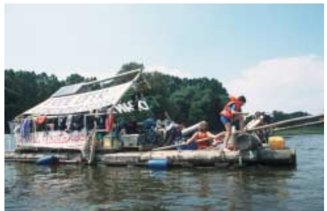
Robin-Wood-Floßtour im Sommer 2002; von der Elbe in Dresden bis zur Havel in Berlin ging die Tour für „Freie Ufer und Lebendige Flüsse“. Mit Vorträgen, Theater, Unterschriftensammlungen und Abseilaktionen wurden auf diesem Weg Hunderte Menschen erreicht.